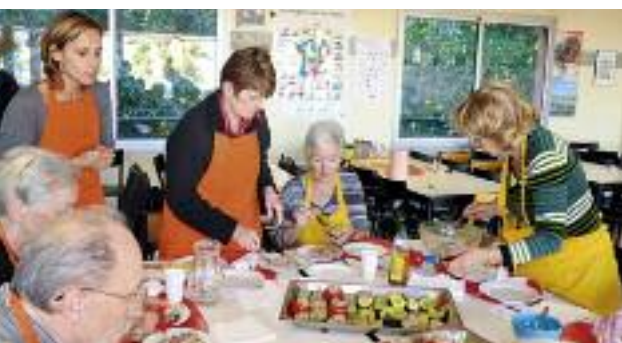
Kochkurs in der Cafeteria der Schule

* DELF Prüfungskurs: Examensgebühren in Höhe von € 100 sind vor Ort in der Schule zu bezahlen.