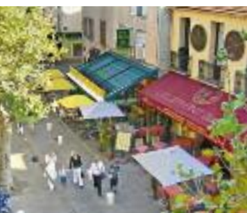
In der Altstadt von Antibes