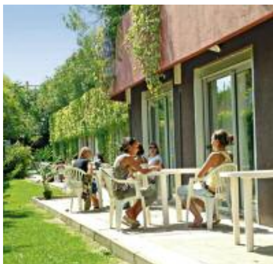
Gemeinschaftsterrasse Schulhotel Garret

3 Schulresidenz & Apartments Castel Arabel p.P. schon ab € 28 1,2 km von der Schule und 600 m vom Strand entfernt. Lage: In schöner und ruhiger, leicht erhöhter Lage in Antibes mit Panoramablick. Ausstattung: Die Residenz verfügt über insgesamt 31 Gästezimmer mit Dusche/WC. Für besonders preisbewusste Gäste stehen sechs Budget Zimmer bereit, die schlicht aber zweckmäßig eingerichtet sind. Halbe Doppelzimmer sind für Teilnehmer bis 30 Jahre möglich. Ein TV Raum, ein Garten mit kleinem Pool, sowie Snack- und Getränkeautomaten stehen Ihnen zur Verfügung. Die Bar „Le Castel Café“ mit Terrasse hat von April bis Oktober geöffnet. Ab acht Wochen Aufenthalt haben Sie Zugang zu einer Gemeinschaftsküche. Zusätzlich sind Apartments mit Wohn-/Schlafraum, Kitchenette und TV buchbar. Die Apartments befinden sich in einem separaten Gebäude auf demselben Gelände. Hinweis: Bei Ankunft ist eine Kautions von € 200 zu hinterlegen. In den Schulferien werden in einem Flügel des Gebäudes jugendliche Sprachschüler untergebracht. Pro Tag und Person fällt eine Kurtaxe von ca. € 1 an. Die Rezeption ist sonntags von 11 Uhr bis 19.30 Uhr für Anreisen geöffnet.