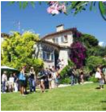
Die Sprachschule „Le Chateau“