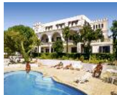
Schulresidenz Castel Arabel

4 Schulhotel Aragon p.P. schon ab € 133 Ca. 15 Gehminuten zur Schule. Lage: In ruhiger Lage zwischen Antibes und Juan-les-Pins, 1,2 km von der Schule Le Chateau und 600 m von den Stränden von Juan-les-Pins entfernt. Ausstattung: 28 moderne und komfortable Studios mit Kitchenette, Klimaanlage, TV, Bad oder Dusche/WC. WLAN ist gegen eine geringe Gebühr nutzbar. Zur Residenz gehören ein hübscher Garten, Münzwaschmaschinen sowie Snack- und Getränkeautomaten. Bettwäsche wird gestellt, bitte bringen Sie eigene Handtücher mit. Für die Reinigung Ihres Studios sind Sie während Ihres Aufenthaltes selbst verantwortlich. Verpflegung: Selbstverpflegung. Hinweis: Bei Ankunft ist eine Kautions in Höhe von € 200 zu hinterlegen. Pro Tag und Person wird eine Kurtaxe von ca. € 1 vor Ort erhoben.