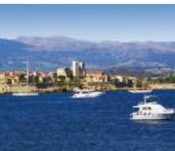
Blick auf Antibes