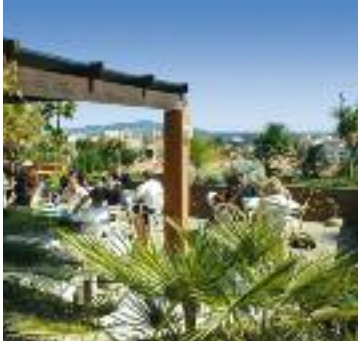
Blick von der Schulterrasse