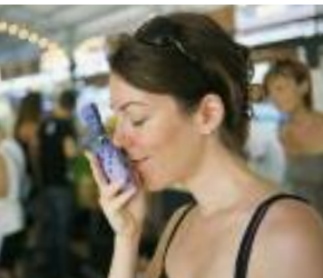
Lavendelduft auf dem Markt