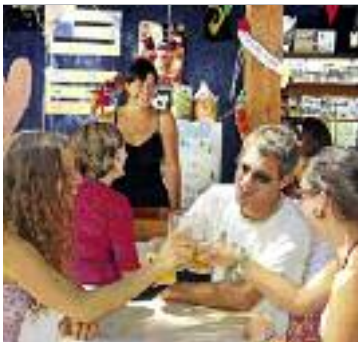
Neue Freunde finden